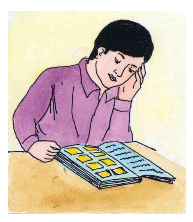
ਕਰ ਲੈ ਤੂੰ ਯਾਦ, ਨਾਲ਼ੇ ਕਰ ਅਭਿਆਸ ਵੇ, ਸੁੰਦਰ ਲਿਖਾਈ ਕਰੇ, ਨੰਬਰਾਂ ਦੀ ਆਸ ਵੇ।