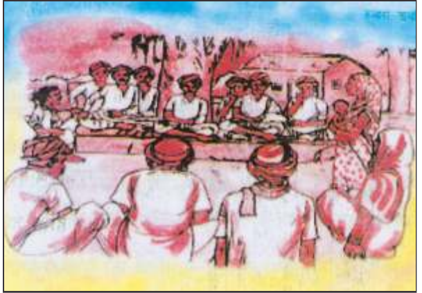
ग्राम पंचायत के लोग आम सभा करते हुए

की है जिसमें महादलितों एवं गरीब परिवार की संख्या सबसे अधिक है। फिर भी वहाँ एक ही सार्वजनिक चापाकल है जिसका सभी लोग उपयोग करते हैं। इससे काफी कठिनाई होती है। साथ ही वह चापाकल कभी-कभी खराब हो जाता