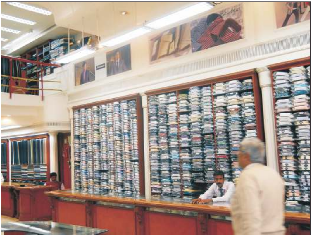
कपड़े का दुकान