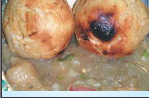
बिहार का लिट्टी-चोखा

इन राज्यों का प्रमुख व्यंजन निम्न प्रकार के हैं—