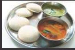
दक्षिण भारत का प्रसिद्ध इडली-डोसा