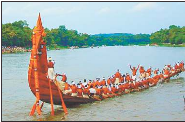
केरल में ओणम के अवसर पर नौका दौड़