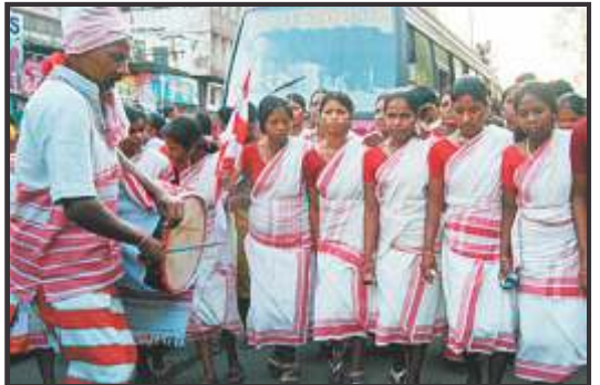
झारखण्ड के सरहुल मनाते लोग