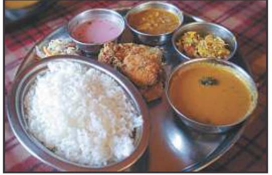
बंगाल का मछली-चावल