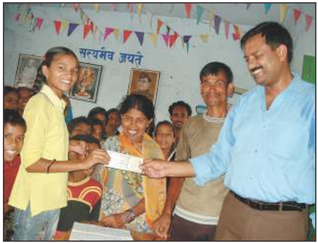
पोशाक की राशि प्राप्त करती छात्राएँ

एवं अन्यायपूर्ण है। इस पर सरकार ने विशेष ध्यान देते हुए लड़कियों की शिक्षा हेतु सरकारी विद्यालयों एवं कॉलेजों में फीस खत्म कर दी है। उनके लिए पोशाक योजना आरंभ की गई है। उसी तरह महादलित बच्चे – बच्चियों पर भी सरकार ने विशेष ध्यान रखते हुए पोशाक के साथ-साथ छात्रवृत्ति योजना आरंभ किया है ताकि उन्हें भी समान अवसर मिल सके।