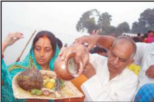
बिहार का छठ पर्व

इतना ही नहीं विभिन्न राज्यों के रीति-रिवाज और त्योहारों में भी भिन्नता होती है। जहाँ बिहार का एक मशहूर पर्व छठ है, पश्चिम बंगाल का दुर्गा पूजा, महाराष्ट्र का गणेश उत्सव एवं केरल का ओणम है। वहीं झारखण्ड में सरहुल पर्व मनाया जाता है।