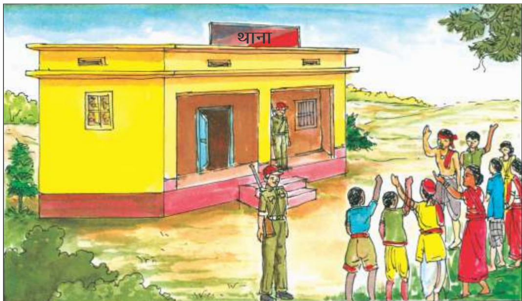
विवादों के समाधान के लिए थाने पहुँचे लोग

हमारा देश लोकतांत्रिक है। यहाँ विभिन्न प्रकार के विवाद उत्पन्न होते रहते हैं। इसके कई कारण हो सकते हैं। उदाहरण के लिए दूसरों के हितों का ख्याल न रखना, आपसी समझ न होना, किसी और की भाषा या क्षेत्र को नीचे देखना आदि। कई बार लोग सरकार के निर्णयों से असहमत होते हैं तथा इससे भी विवाद उत्पन्न होता है। सरकार की जिम्मेदारी होती है कि वह विवादों का समाधान करे ताकि वह हिंसा का रूप नहीं ले। आइए, अपने समाज के कुछ विवादों पर नजर डालें तथा देखें कि सरकार इसके समाधान में कैसे भूमिका निभाती है।