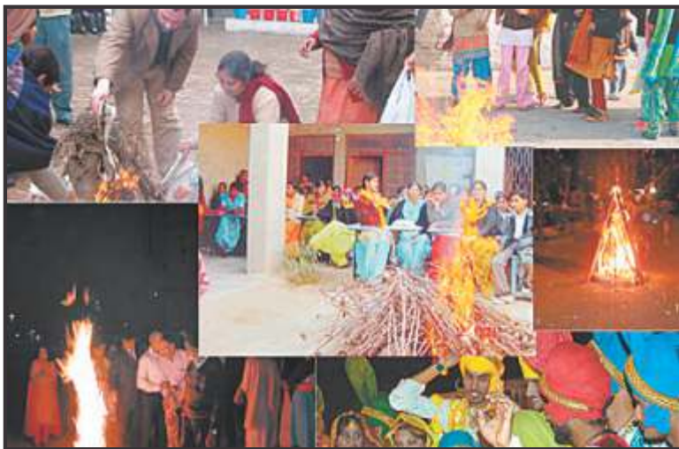
पंजाब में लोहड़ी पर्व मनाते लोग

इस प्रकार हम देखते हैं कि भारत के विभिन्न राज्यों के निवासियों के अलग-अलग खान-पान, वेश-भूषा, रीति-रिवाज एवं पर्व-त्योहार विविधता को दर्शाते हैं।